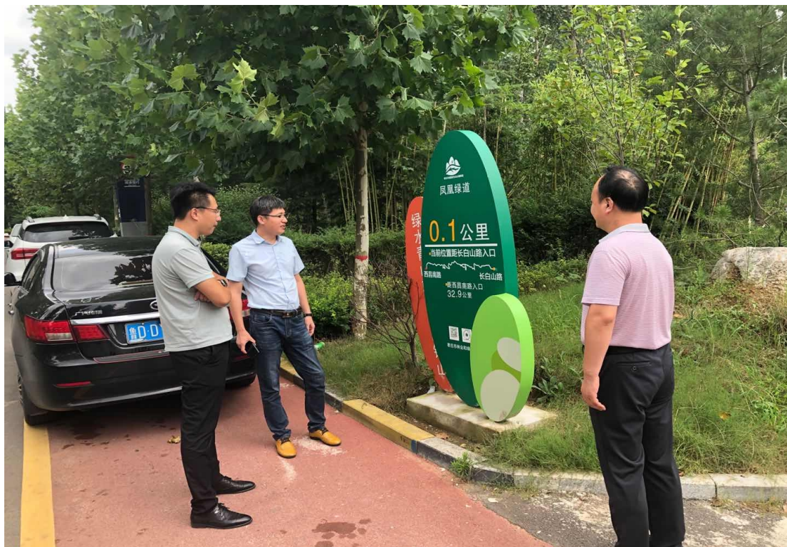
凤凰绿道现场调研